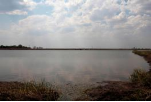
Pantano n° 1. Así ha quedado el humedal