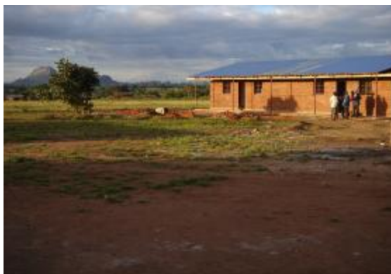
El aula principal