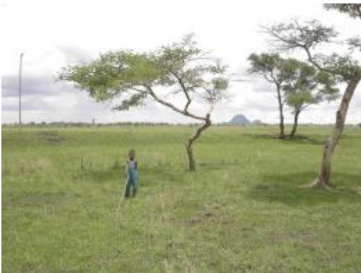
Así era en un principio: Un humedal

Se aprovechó para ello el antiguo cauce del río Mlale, que estaba atravesado por un ancho camino. Se elevó el camino cinco metros de alto y se profundizó el cauce dos metros más. Con lo cual, quedó una presa con una capacidad de 10 millones de litros. Más tarde, con un segundo dique, se consiguió una segunda presa de 20 millones de litros.