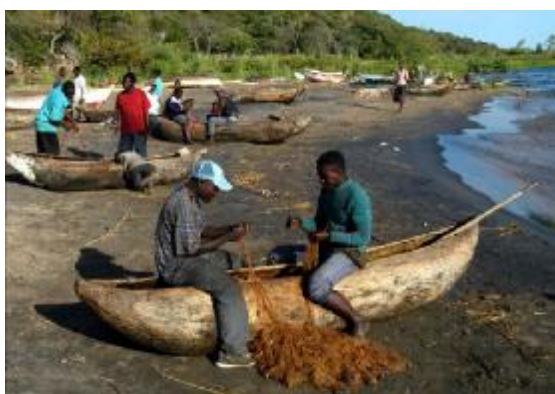
A orillas del lago Nyassa