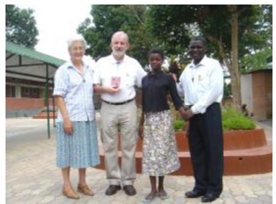
Niña operada en Sevilla. Hosp. Virgen del Rocío