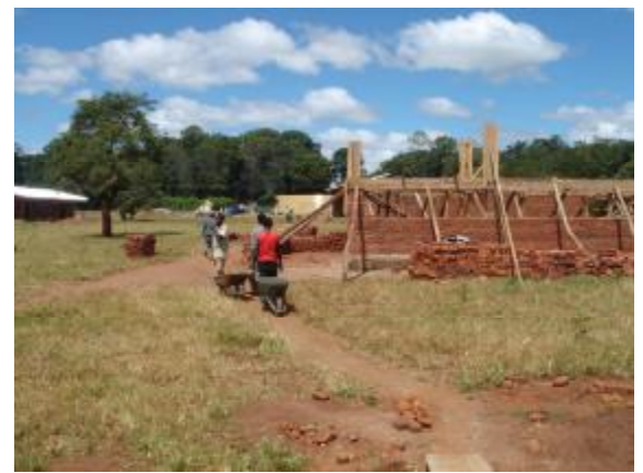
Al fondo, el tanque; a la izquierda, un aula