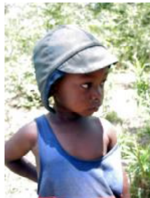
El futuro está en sus manos