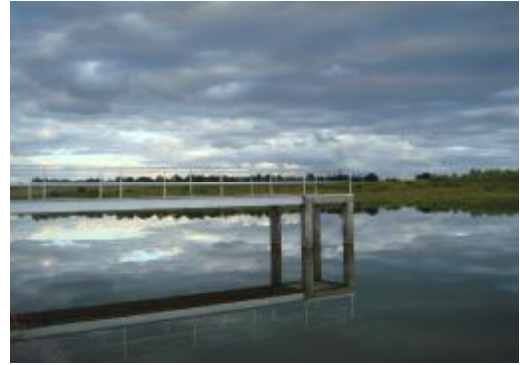
Torreta para instalar la bomba