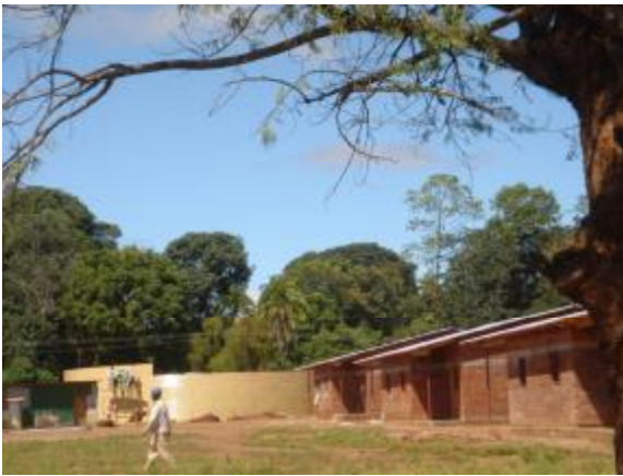
La escuela agrícola. Casas de los monitores