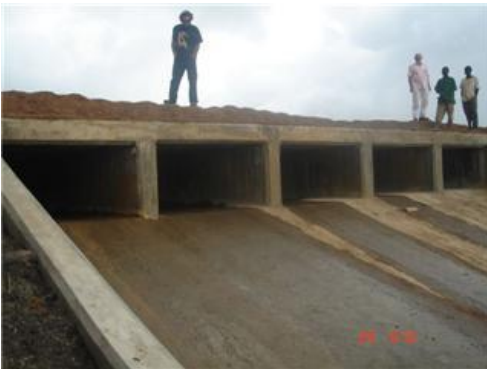
Vertido de aguas del 1° al 2° pantano