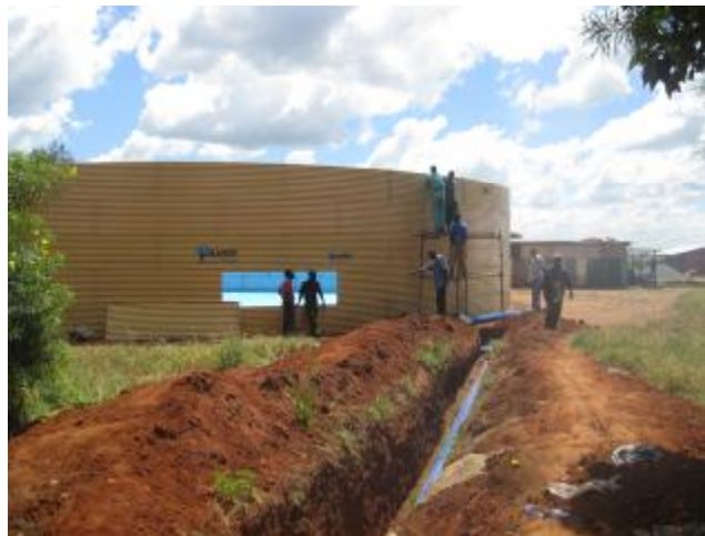
Tanque de 1.500.000 litros