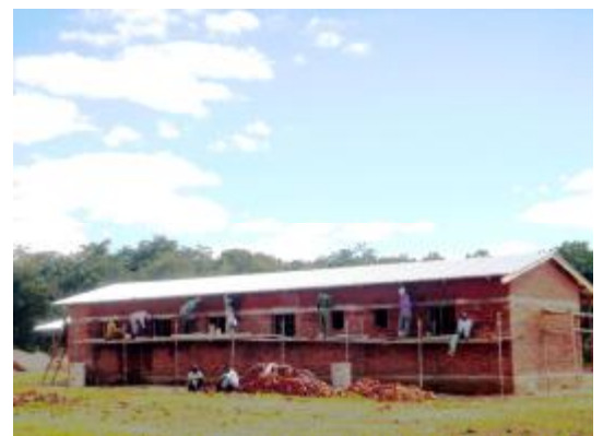
Fachada del aula principal