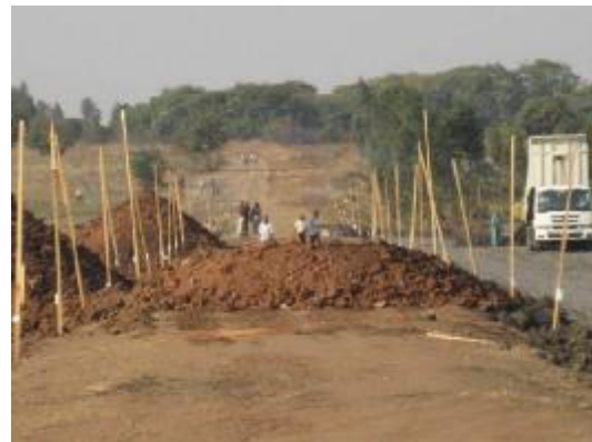
Se alzó 5 m. el camino que lo cruzaba