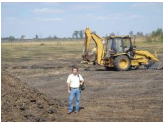
Se excavaron 2 m. para lograr una profundidad de 6 m. en el centro de la presa.