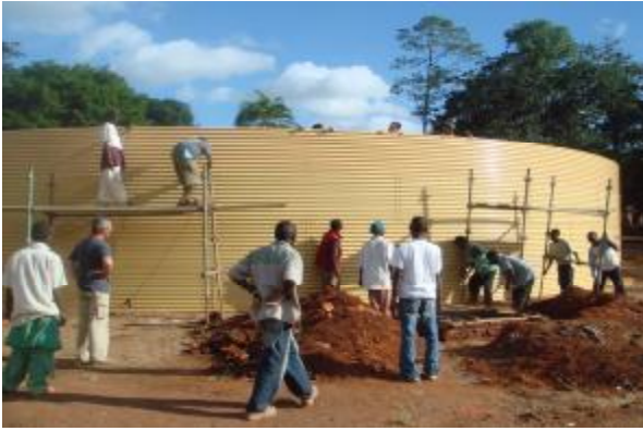
Detalles de la construcción del tanque