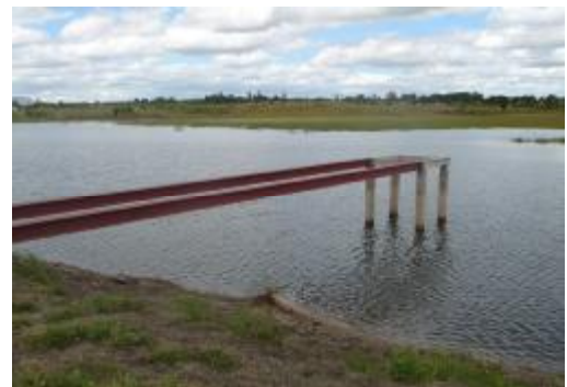
Segundo pantano, con torreta

Una vez terminados los pantanos, era preciso bombear el agua hasta un montículo, donde instalar un gran tanque de almacenamiento. Desde allí sería más fácil distribuir el agua aprovechando la fuerza de la gravedad.