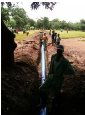
Desde el pantano hasta el tanque

Una vez terminados los pantanos, era preciso bombear el agua hasta un montículo, donde instalar un gran tanque de almacenamiento. Desde allí sería más fácil distribuir el agua aprovechando la fuerza de la gravedad.