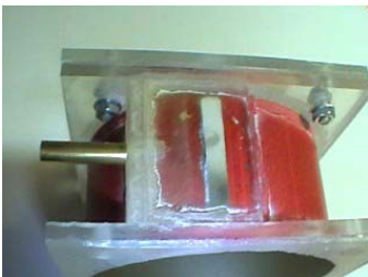
Detalle de la entrada de aire