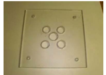
y de la salida