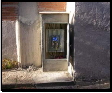
Caja General de Protección conectada y acabada