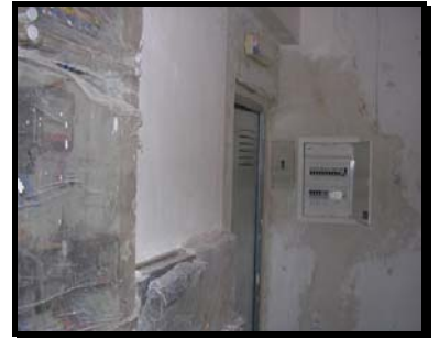
Centralización de contadores acabada de albañilería