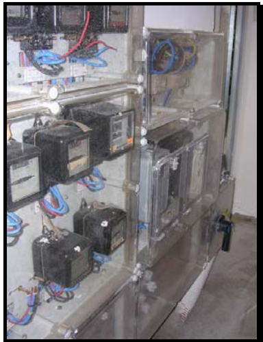
Centralización de contadores acabada