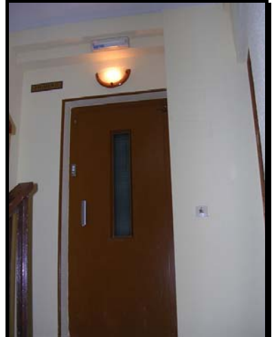
Acabado de pintura en rellanos