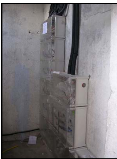
Fase de la instalación de la Centralización de Contadores