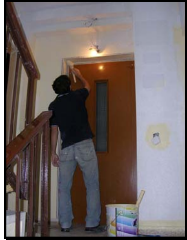
Detalle del proceso de pintado de partes afectadas