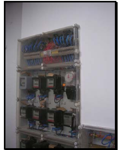
Centralización de contadores acabada