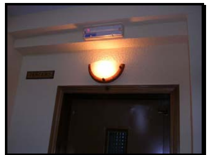
Acabado de rellanos