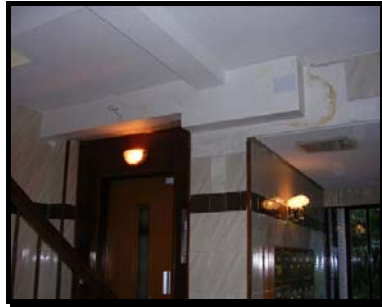
Falsas vigas en portal