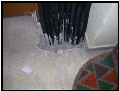
Calas en forjados y cortafuegos de obligada realización