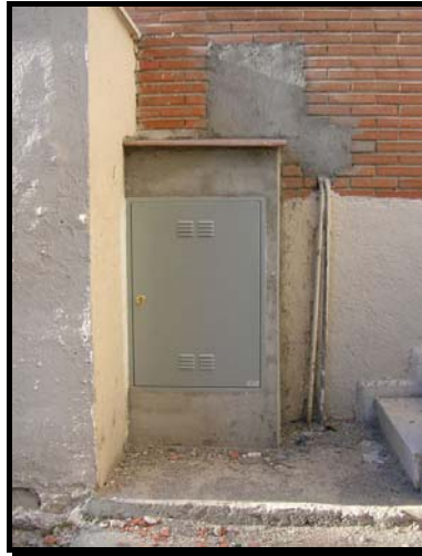
Caja General de Protección acabada