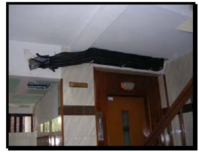
Canalizaciones Derivaciones Individuales en portal