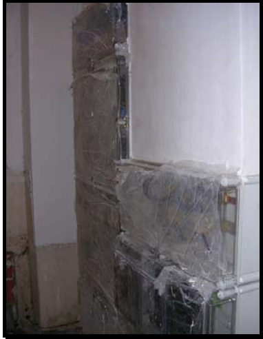
Detalle de centralización acabada y a falta de pintar