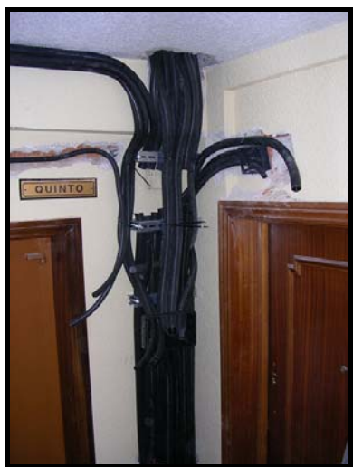
Canalizaciones para Derivaciones Individuales y servicios generales en plantas