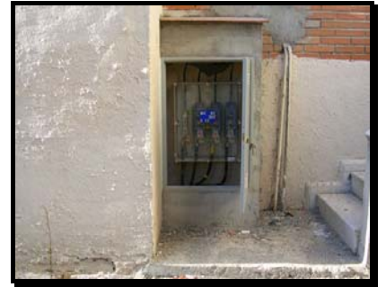
Caja General de Protección conectada y acabada