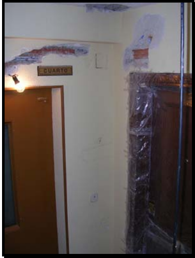
Rozas y calas en rellanos para canalizaciones de la reforma eléctrica