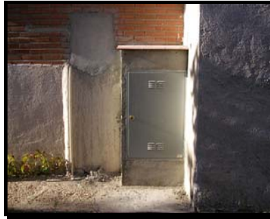
Caja General de Protección acabada