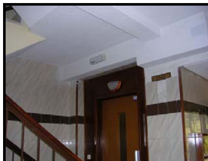
Acabado zonas afectadas en portal