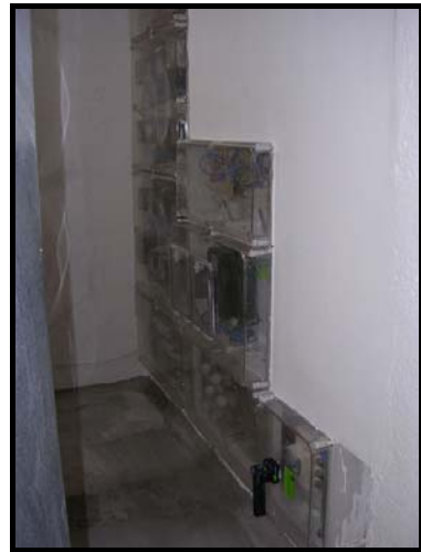
Centralización de contadores acabada