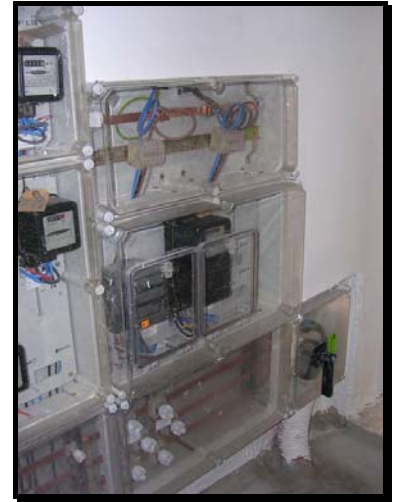
Centralización de contadores acabada