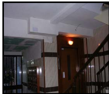
Proceso de pintado de partes afectadas en portal