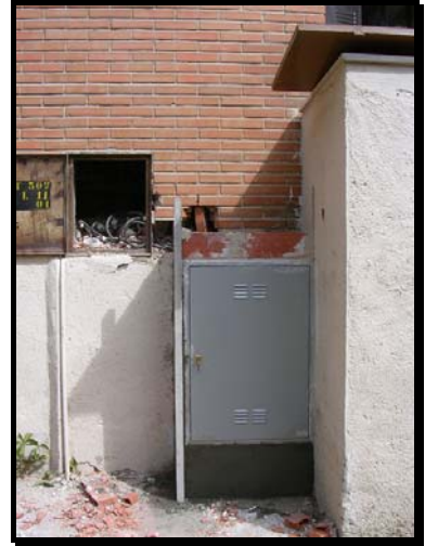
Realización del michinal en C. G. P. con puerta homologada