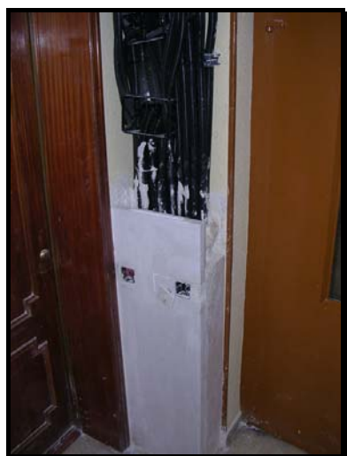
Realización de mochetas o falsos pilares para tapado de canalizaciones