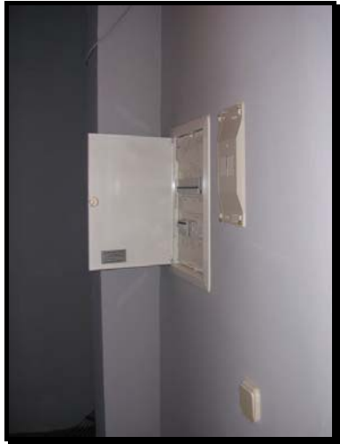
Cuadro General de Distribución de la finca acabado