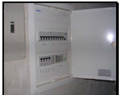
Detalle del Cuadro General de Distribución de los servicios generales de la finca