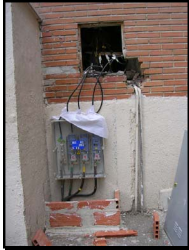
Caja General de Protección en acometida