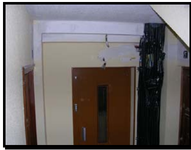
Detalle de Canalizaciones de las Derivaciones Individuales