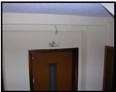
Acabado de pintura de partes afectadas a falta de instalar elementos de iluminación