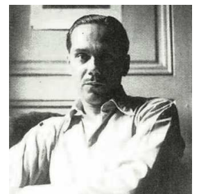
Luis CERNUDA. Poeta.

Sus recursos y trazos más significativos son: