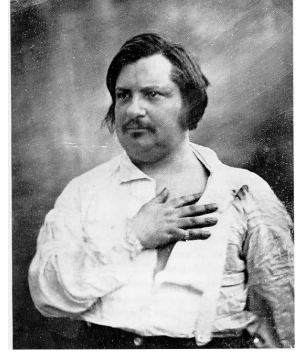
Honoré de BALZAC. Novelista.

CONCLUSIÓN: Se trata de un género mixto , en el que alternan la voz del narrador, en 3ª persona, y la de los personajes. Por medio de la narración, la descripción y el diálogo, se cuenta, describe y actualiza una historia del pasado, que en la epopeya se refiere a los orígenes heroicos de un pueblo o nación.