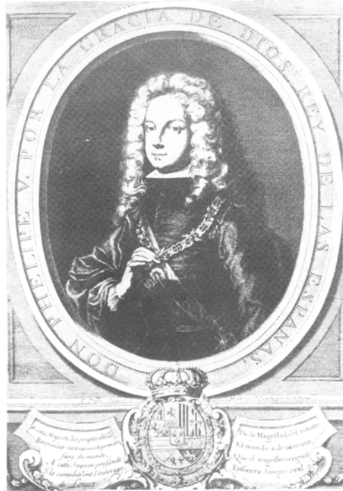
(Fig. 2) Felipe de Anjou.